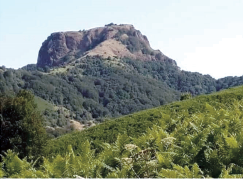
ŞINDAN QALASI (Astaran rayonu. Eramızın III əsrinə aid abidə)