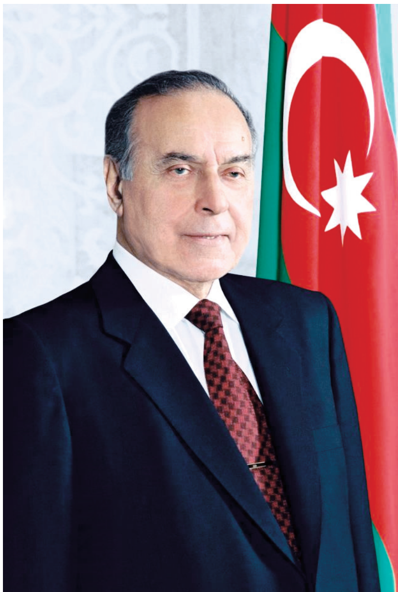
UMİMMİLLİ LİDER HEYDƏR ƏLİYEV