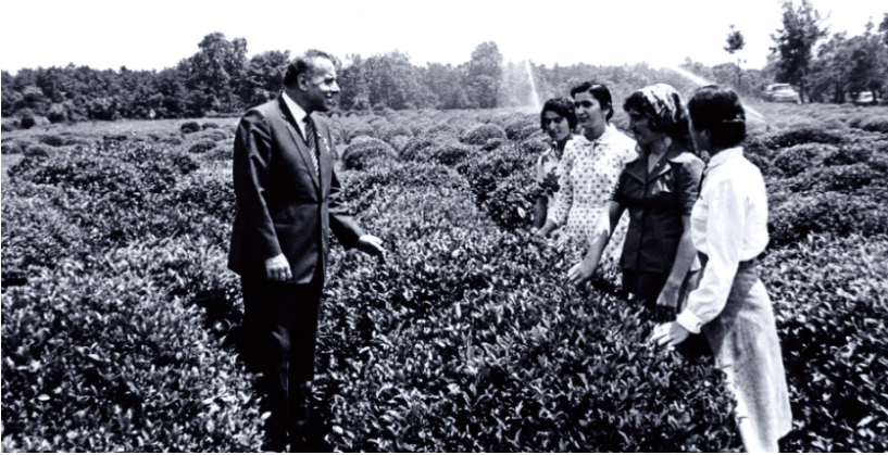
Heydər Əliyev de Ostorə zəhmətəkəşon

XIX pensorədə çay səpə ixtisasınbıə sovxozon təşkili çı istehsolati nişonon əsosinə çok kardeədə, çayə plantasiyon məhsuldorəti barzbey iyən umuyə çayə livə qırdəkardey 2,5-4,0 kərə heyve bey səbəb bıə.