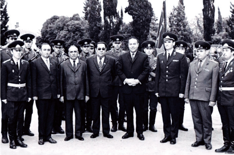
Heydər Əliyev de çəkiston

dəvoniyə, “Respublikə çəkiston kəşfiyyot iyən əskəkəşfiyyot sahədə” mivzuədə i saat gəder məruzə kardəşe.