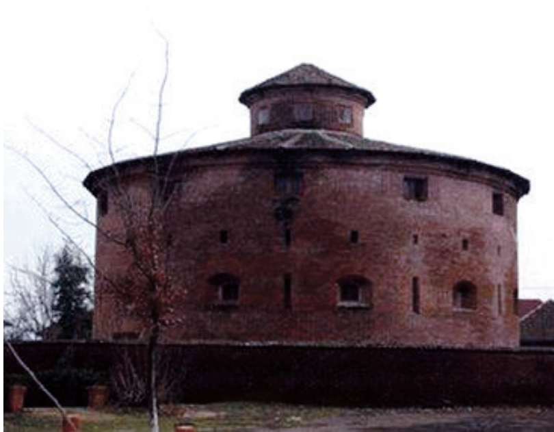
DAİRƏVIYƏ ĞƏLƏ (Lankon şəhri. XVIII əsri aid əhəmiyyətinə memarəti abidə)