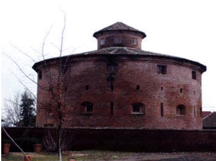
DAİRƏVİ QALA (Lənkəran şəhəri. XVIII əsrə aid yerli əhəmiyyətli memarlıq abidəsi)